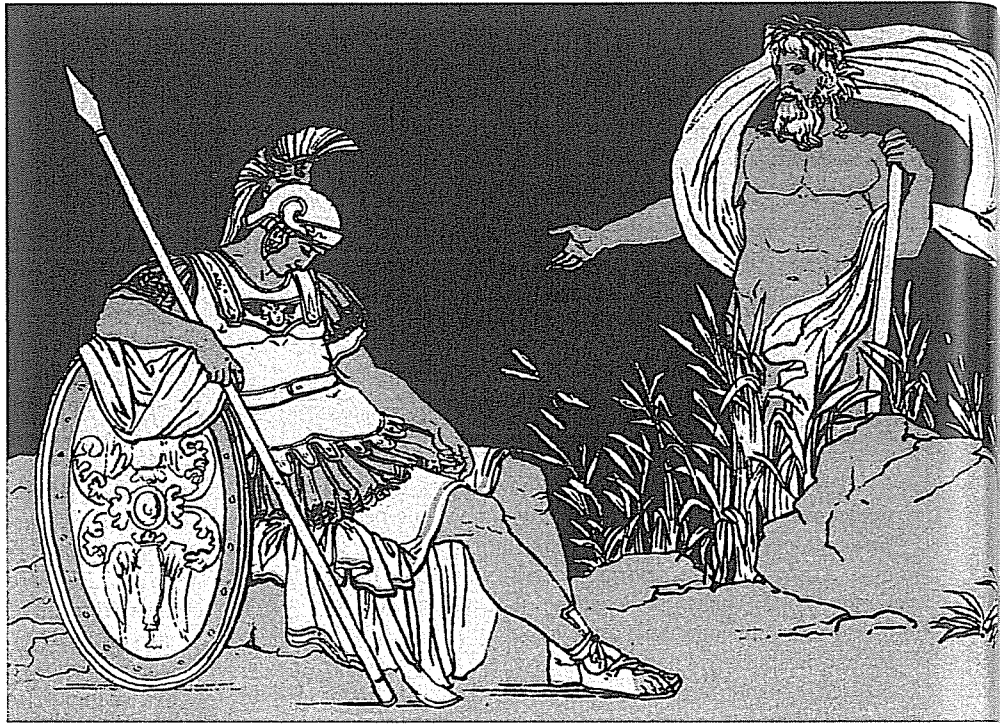
Bartolomeo Pinelli. Eneas y el Tíber.

"Romano, acuérdate de que naciste para gobernar a los pueblos con autoridad. Este es tu destino, dictar leyes de paz entre las naciones, someter al soberbio y perdonar al vencido". Virgilio. Eneida.