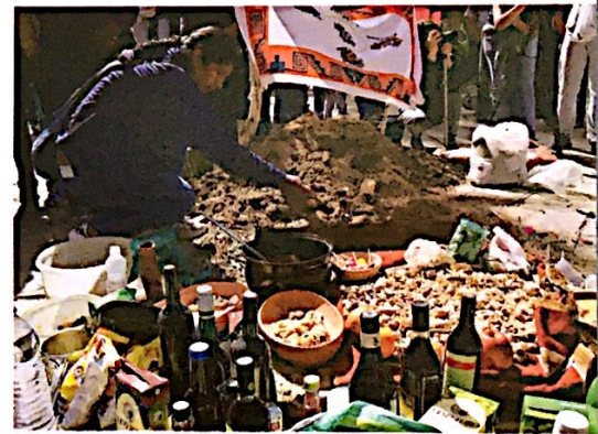
▲ Celebración de la Pachamama en Cachi, Salta, en agosto de 2017. Esta festividad se realiza cerca del fin del invierno, antes de la roturación de las tierras de cultivo.

● En Lengua y Literatura II Convergente (Bloque II, unidad 5), pueden leer un discurso sobre los derechos de los pueblos originarios de América.