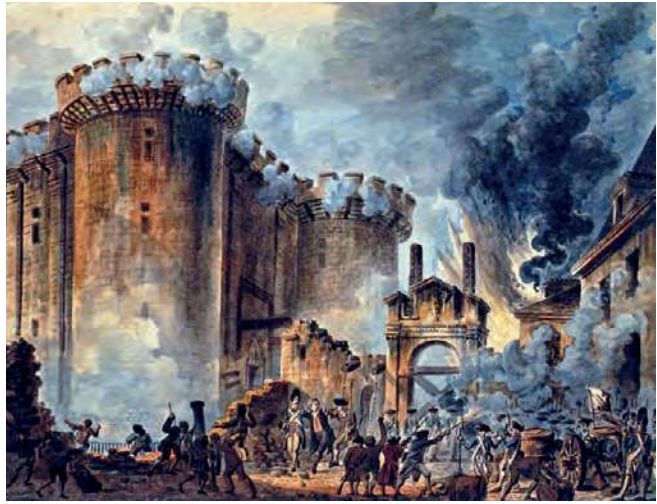
Jean-Pierre Houël, Toma de la Bastilla (1789), acuarela.

En la Asamblea, se formaron distintos grupos políticos: los girondinos , más moderados, y los jacobinos , que buscaban abolir completamente la monarquía. Con el tiempo, estos últimos ganaron adeptos entre la población. En 1792, los revolucionarios apresaron al rey y a su familia –a los que luego ejecutaron– e instauraron una república. El gobierno quedó en manos de la Convención Nacional , formada por los representantes elegidos por el pueblo a través del sufragio universal de los varones adultos.