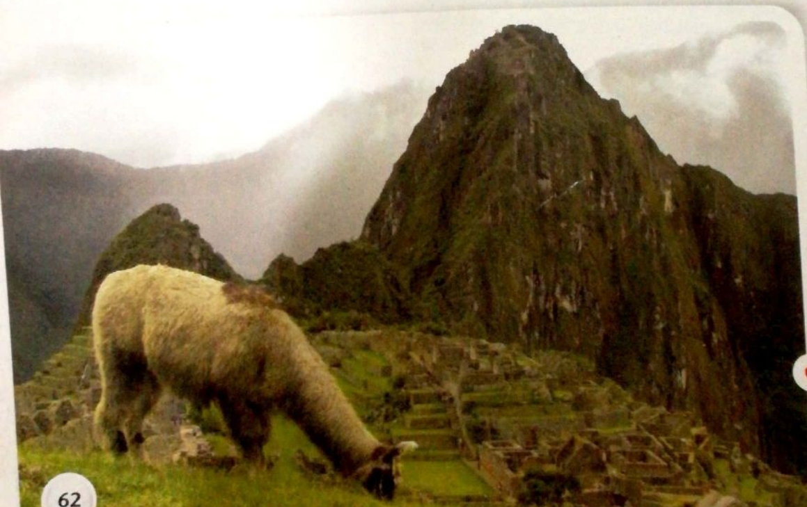
En América, la llama fue usada como animal de carga antes de la llegada de los europeos. Este animal soportaba un peso de hasta cincuenta kilos en sus lomos.

Criaban llamas, vicuñas y alpacas, que los proveían de lana para sus tejidos. La llama tenía, además, otros usos: era animal de carga y servía para realizar sacrificios a los dioses.