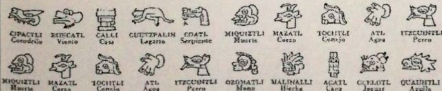
El calendario azteca combinaba veinte signos que representaban los días.