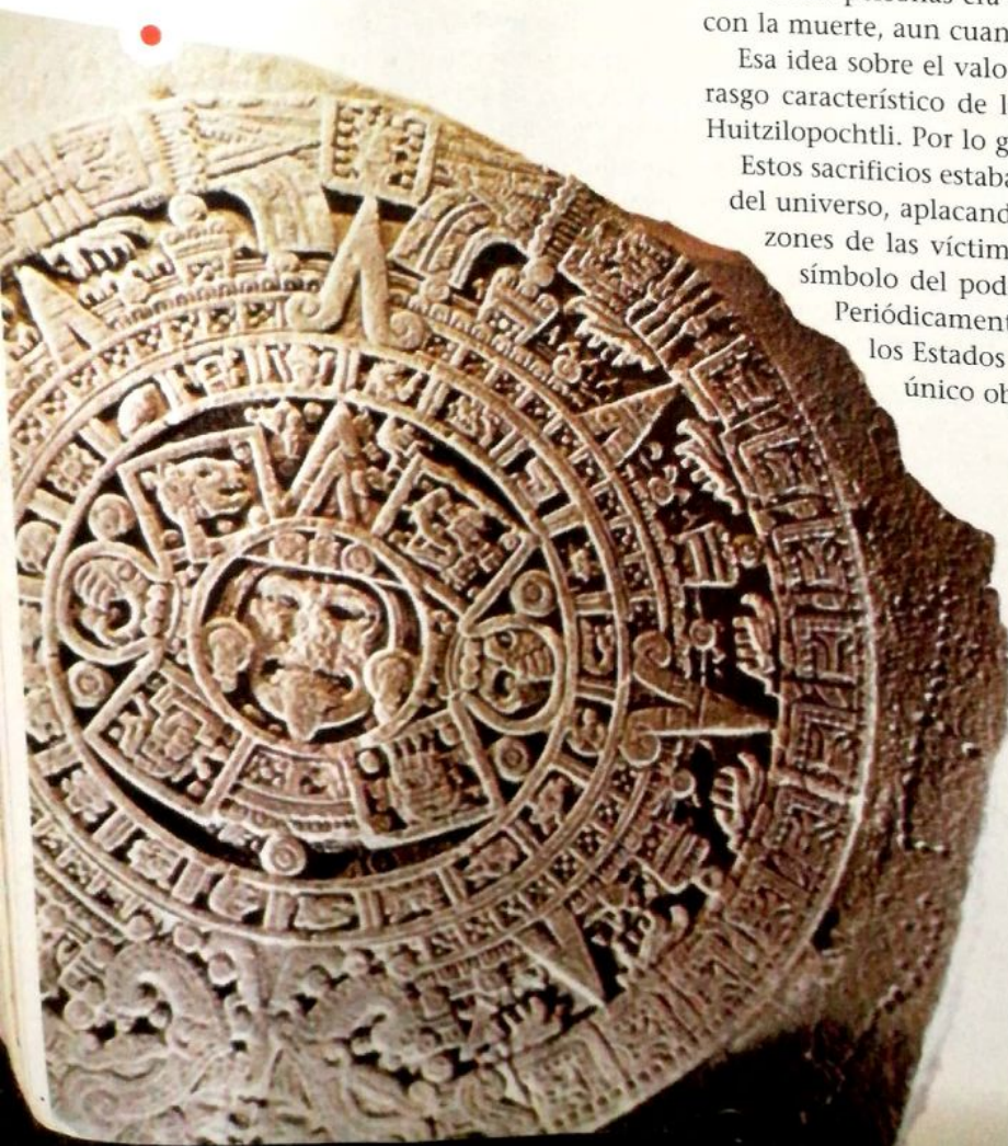
La Piedra del Sol conmemora la quinta era de la mitología azteca.

Periódicamente se hacía una declaración de guerra contra alguno de los Estados vecinos, a la que se conoce como "guerra florida". Su único objetivo era tomar prisioneros para los sacrificios. (+INFO)