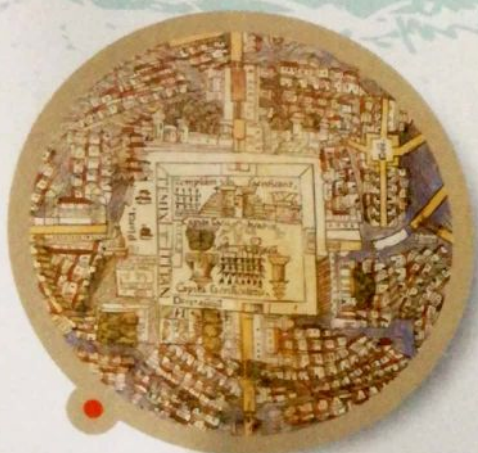
Plano de la ciudad de Tenochtitlán. Solo se podía acceder a esta ciudad a través de cuatro calzadas que la conectaban con la orilla del lago Texcoco. Estaba atravesada por calles de piedra y en los bordes, por canales. Se cree que llegó a tener alrededor de 300.000 habitantes.

Cuando el tlatoani debía tomar decisiones fundamentales, por ejemplo la declaración de la guerra, deliberaba con algunos asesores. El más importante era el cihuacóatl , quien colaboraba con él en el gobierno y lo reemplazaba en caso de ausencia. En los niveles inferiores había muchos funcionarios; entre ellos, los jueces encargados de vigilar el cumplimiento de las normas y los guardianes de los depósitos de armas.