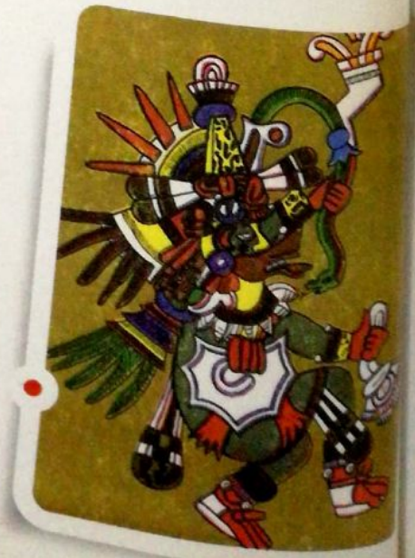
Escultura de Quetzalcóatl, la serpiente emplumada, en el centro ceremonial de Teotihuacán.