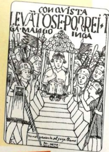
Imagen de Manco Cápac, dibujo de Huaman Poma de Ayala.

La panaca estaba formada por todos los descendientes varones de un determinado Inca, salvo el sucesor, quien a su vez creaba una nueva panaca .