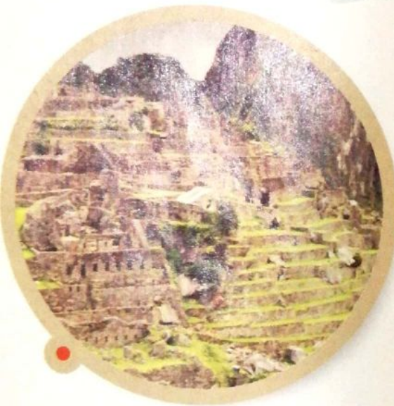
Terrazas escalonadas, en las ruinas de Machu Picchu (Perú).